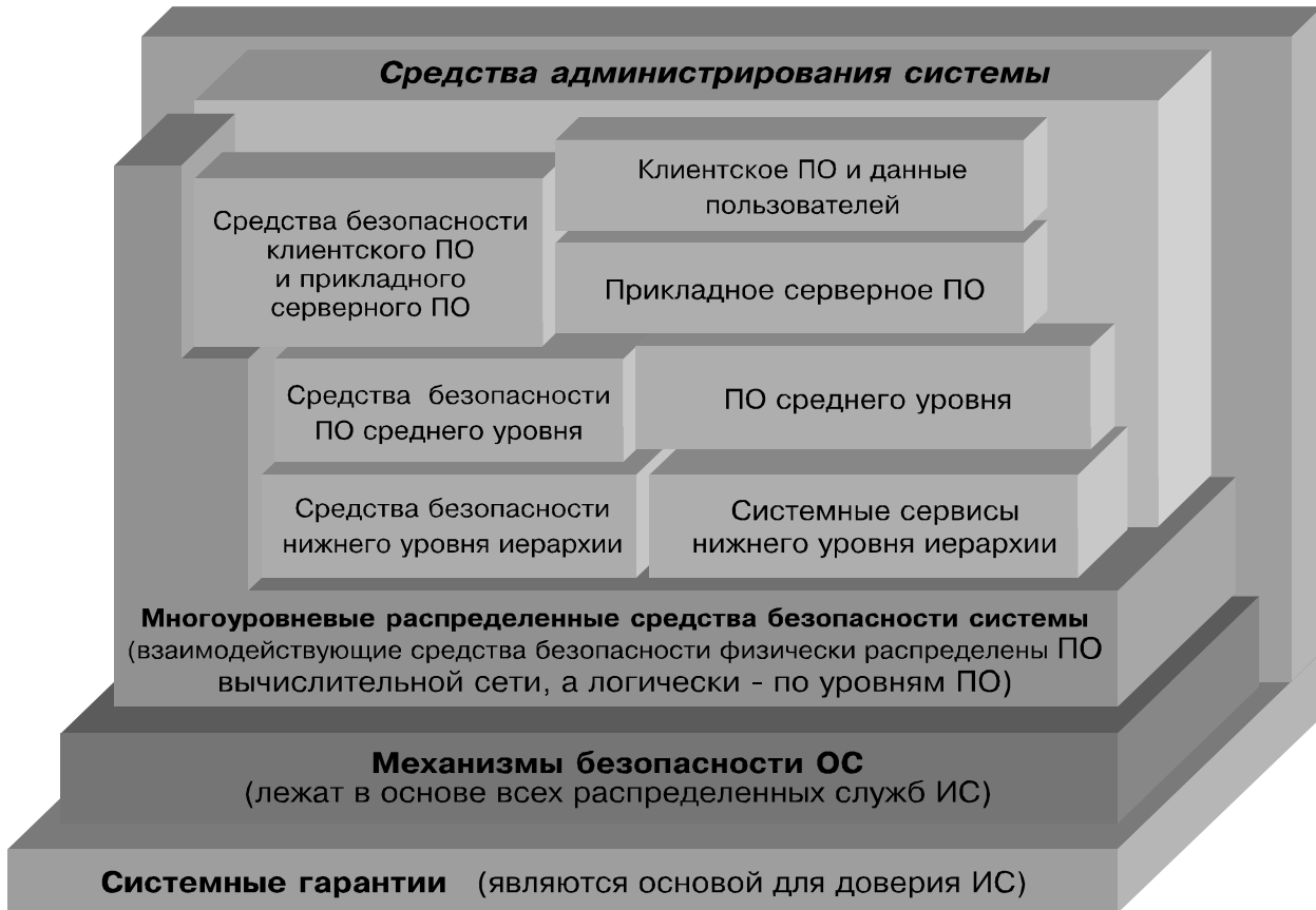
Рис.3. Распределенная система безопасности ИС

компонентов ИС. Следует учитывать, что встроенные средства безопасности некоторого компонента инфраструктуры ИС или прикладного ПО создавались не для решения задач безопасности ИС, а для решения задач безопасности именно данного компонента инфраструктуры или прикладного ПО. Таким образом, совокупность встроенных средств безопасности компонентов инфраструктуры и прикладного ПО ИС еще не образует системы безопасности ИС - они не объединены в рамках ИС некоторой структурной организацией (т.е. не организованы как система) и не обеспечивают в общем случае решения задач безопасности для ИС. Необходимо также учитывать, что система безопасности ИС кроме чисто технических аспектов имеет и организационно-правовые аспекты обеспечения безопасности.