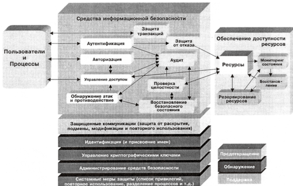
Рис.2. Составляющие обеспечения безопасности ИС

ния нарушений безопасности и ликвидации последствий в случаях, когда нарушение не было предотвращено; средства общей поддержки безопасности. В целом обеспечение безопасности ИС должно носить комплексный характер и сочетать программно-технические средства безопасности инфраструктуры ИС и прикладных систем с организационными мерами безопасности.